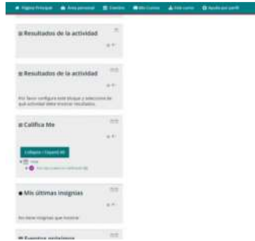
Imagen del bloque calificame que se encuentra del lado izquierdo del curso, solo donde se ven las actividades pendientes.