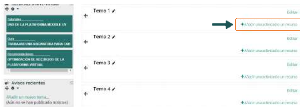
Imagen del aula con la edición activada, donde se puede ver en la parte central el enlace a añadir una actividad o recurso.

Este recurso ofrece la posibilidad de enlazar cualquier página web externa con contenidos de interés. Para agregar una URL en un curso habrá que seguir los siguientes pasos: En el modo Edición, nos posicionamos en el tema donde deseamos que aparezca el enlace al sitio web, y elegimos la opción “Añadir una actividad o recurso”.