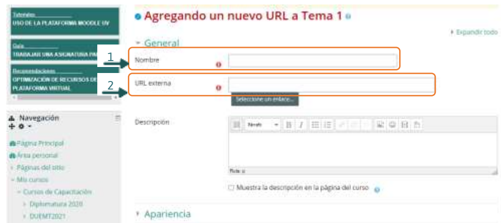
Imagen de la sección general al seleccionar agregando un nuevo URL, que se abre al presionar el recurso seleccionado.

Elegir la manera en que se mostrará la página web enlazada: