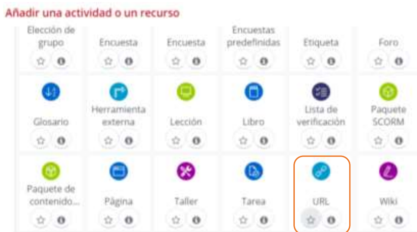
Imagen de la lista desplegable para seleccionar el recurso URL, una vez presionado añadir actividad o recurso.

En la lista desplegable debe seleccionar el recurso URL, luego presionar agregar.