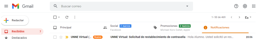
Imagen de la vista en su correo personal del mensaje de UNNE Virtual para recuperar la cuenta moodle.

Se le enviara a su correo electrónico el link de recuperación de la cuenta, si no está en la bandeja de entrada revise también el correo no deseado.