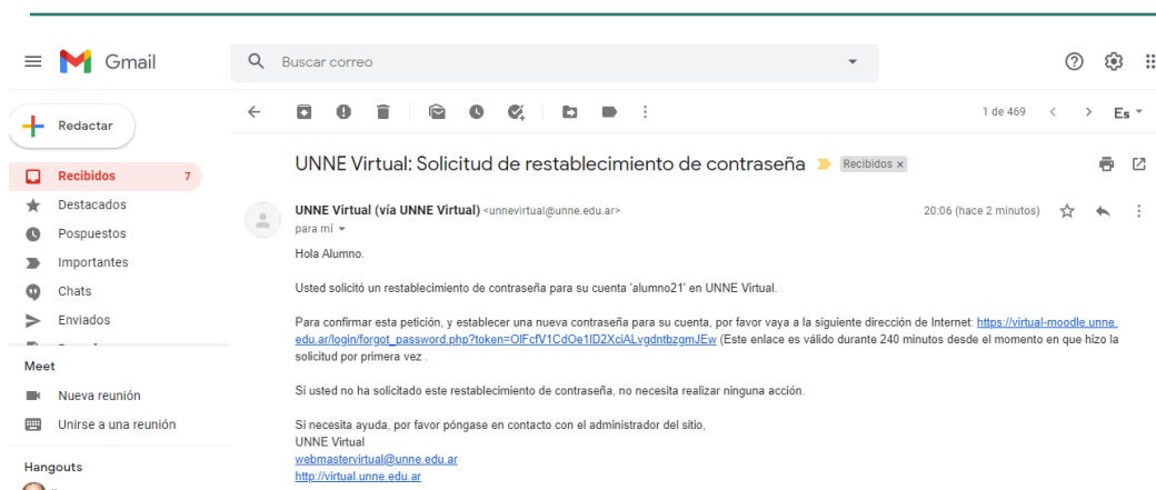
Imagen del mensaje recibido de UNNE Virtual con el link de recuperación que se envía.

Ingrese al mail y podrá ver el siguiente mensaje con el link que deberá acceder, es importante que recuerde que una vez que realiza el pedido de recuperación tiene un tiempo de 240 minutos pasado ese tiempo no podrá acceder por este link y deberá hacer todos los pasos de nuevo.