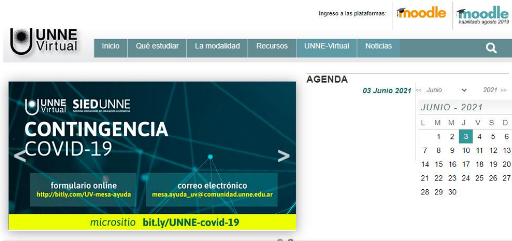
Imagen de la vista principal de la página de UNNE Virtual, en donde se muestra el botón de acceso a la plataforma en la parte superior derecha

Una vez dentro del sitio de UNNE Virtual dirijo a la parte superior de la página donde encontramos un botón que dice moodle en color naranja.